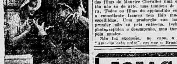
Aurice Chevalier e Jenette Mac Donald, em "Aman-se esta noite", film do Paramount

Uma só expressão falou, um só ambiente impregnou, um só viveu... Tudo a expressão psicológica, inquietude de alma, desejo e flama.